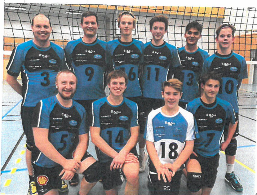
2.div herrer i Liernehallen: Bak