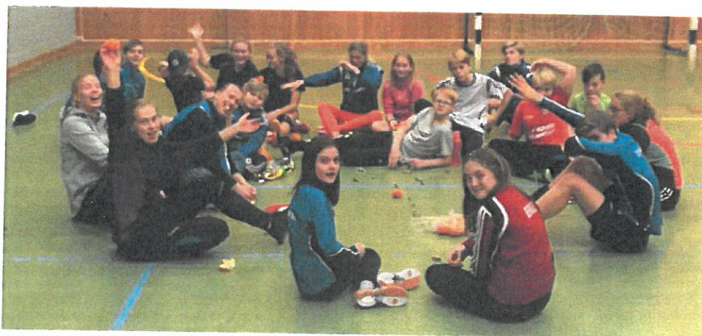
Jule-avslutning i Sørli!

Oppstart U15-treninger torsdager i Liernehallen.