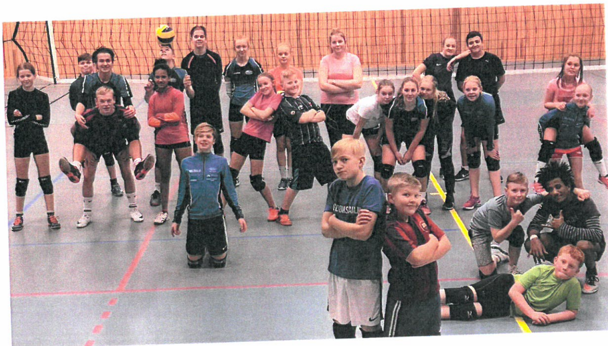
Jule-avslutning i Nordli!