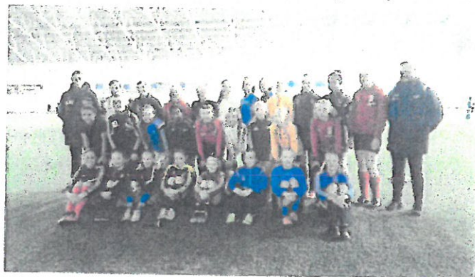
Kretslaget j2003 våren 2016.