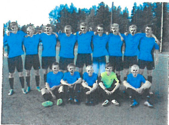
G16 laget