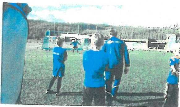
Del 2 kurs med Keepertrening 1.