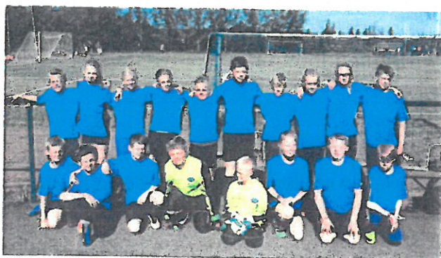
Begge g12 lagene.

G12 – begge lagene gikk videre til B sluttspill og Lierne 2 tapte mot Sverre IL og Lierne 1 tapte med Offerdal IF på fredagen og var dermed ferdige for årets storsjøcup. G14 kom til B sluttspill, og de tapte første kampen på fredagen mot Orkla. J15 kom til kvartfinale i B sluttspill. Spilte en god kamp mot OPE, men tapte. G16 ble på andre plass i gruppespillet og gikk dermed videre til A sluttspill. I A sluttspillet kom de til kvartfinale. De spilte mot Stjørdals Blink og tapte denne kampen. Dette er det lengste Lierne har kommet på storsjøcupen under alle år med deltakelse.