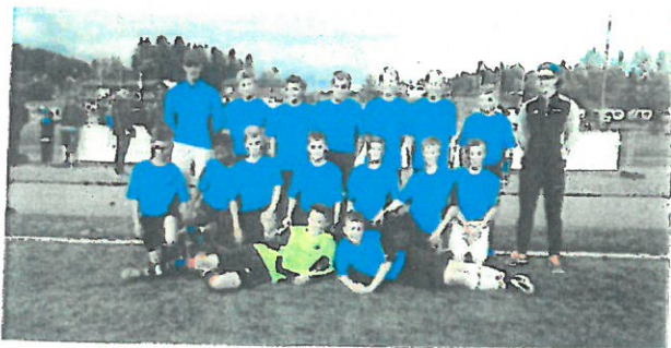
G14 laget.