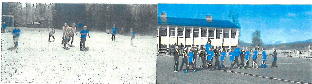
Grenselir i Sørli og Nordli