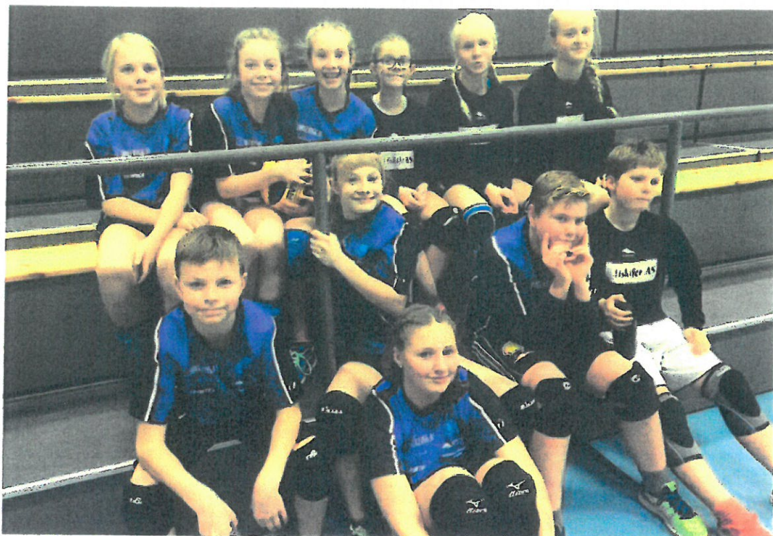
MINIVOLLEYBALL-TURNERING i Verdal med 3 lag fra Lieme.