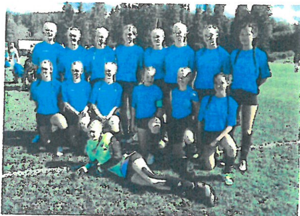
J15 laget