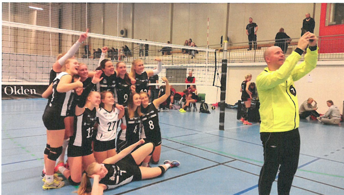
Selfie- trener/J19 i Sandane.