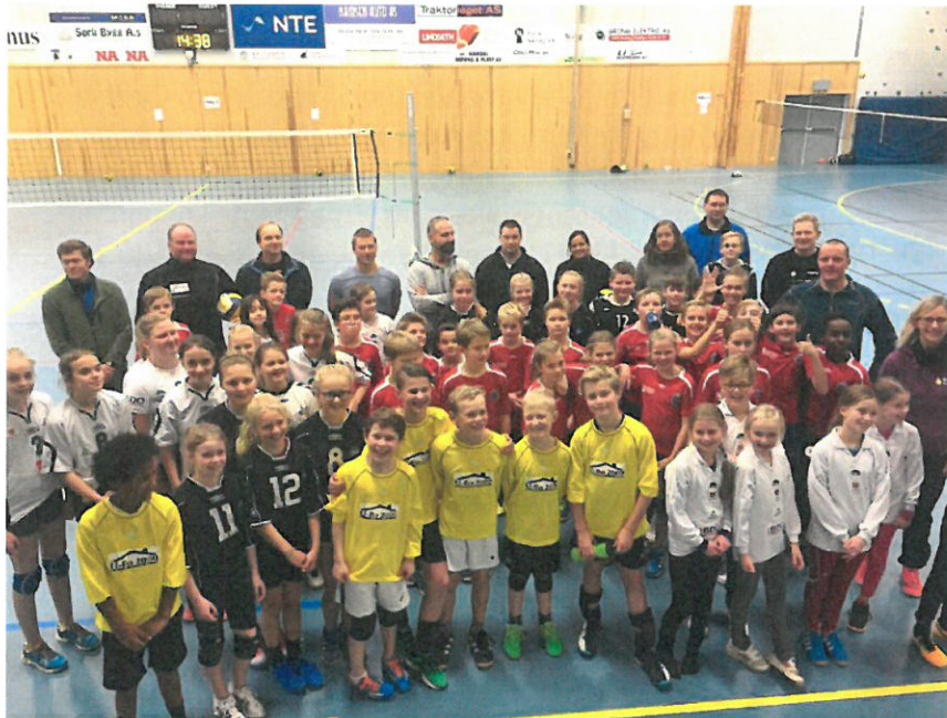
MINIVOLLEYBALL-TURNERING i Lierne med lag fra: Namsos, Grong, Snåsa og Lierne.

Lierne har denne sesongen deltatt på kun 1 Mini-volleyball-turnering, og den arrangerte vi hjemme. Vi deltok med 3 lag. De andre gangene har det kollidert med andre ting!